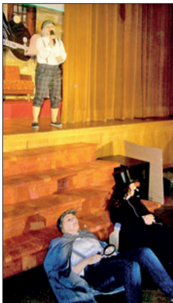
Impression von der letzten Saison – Sherlock Holmes und Dr. Watson