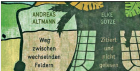
© zuckerimkaffee unter Verwendung des Buchcovers vom Poetenverlag Leipzig

Für das Zustandekommen der Lesung ist vor allem dem Sächsischen Literaturrat e. V. Leipzig mit der in Hainichen auch anwesenden Geschäftsführerin Dr. Tröml herzlich zu danken.