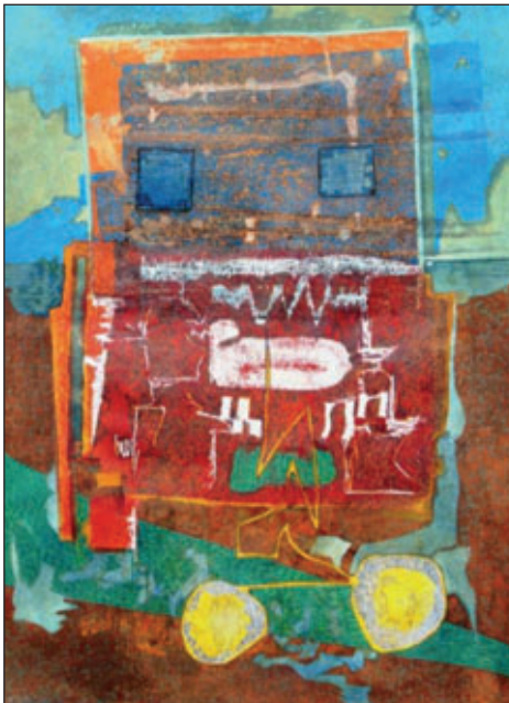
Parcours. Monotypie, Tusche, Kreide, Bleistift, 2011