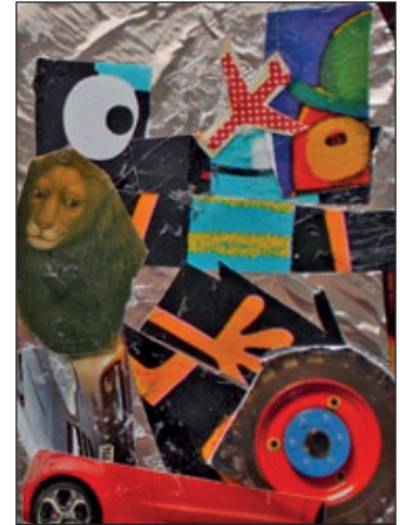
Davit, Collage 2017

Das Mailart-Projekt »Collagen 7 x 5« wird seit 5. April im Heinrich-Hartmann-Haus in Oelsnitz präsentiert. Zahlreiche Hainichener, darunter »MuseumsKinder« des interkulturellen Projektes »Wir sind alle fabelhaft«, hatten sich daran beteiligt. Die Galerie ist Donnerstag von 9 bis 17 Uhr, Freitag bis Sonntag von 14 bis 18 Uhr geöffnet.