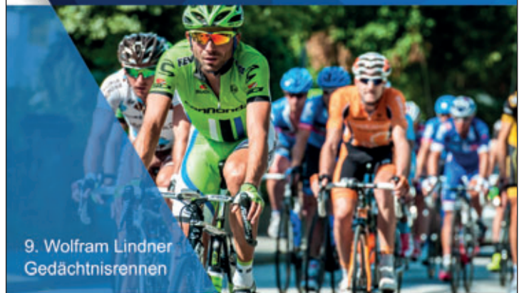
9. Wolfram Lindner Gedächtnisrennen