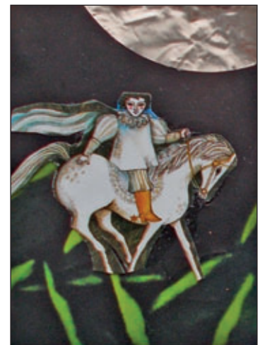
Davit, Collage 2017