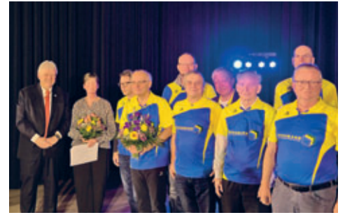
Auszeichnung der Schachspieler des SV Motor Hainichen für jahrzehntelange Erfolge auf Landesebene