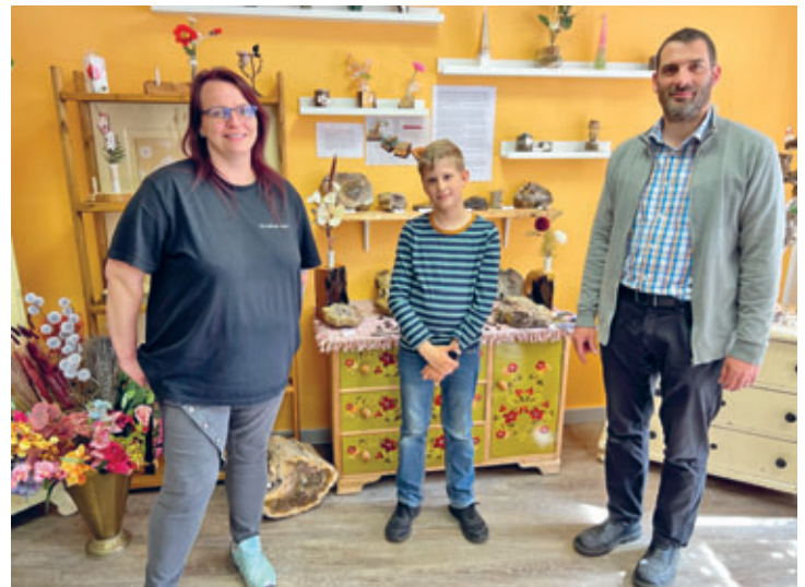
Das kreative Holzstübchen – ein neues Geschäft am Hainichener Neumarkt