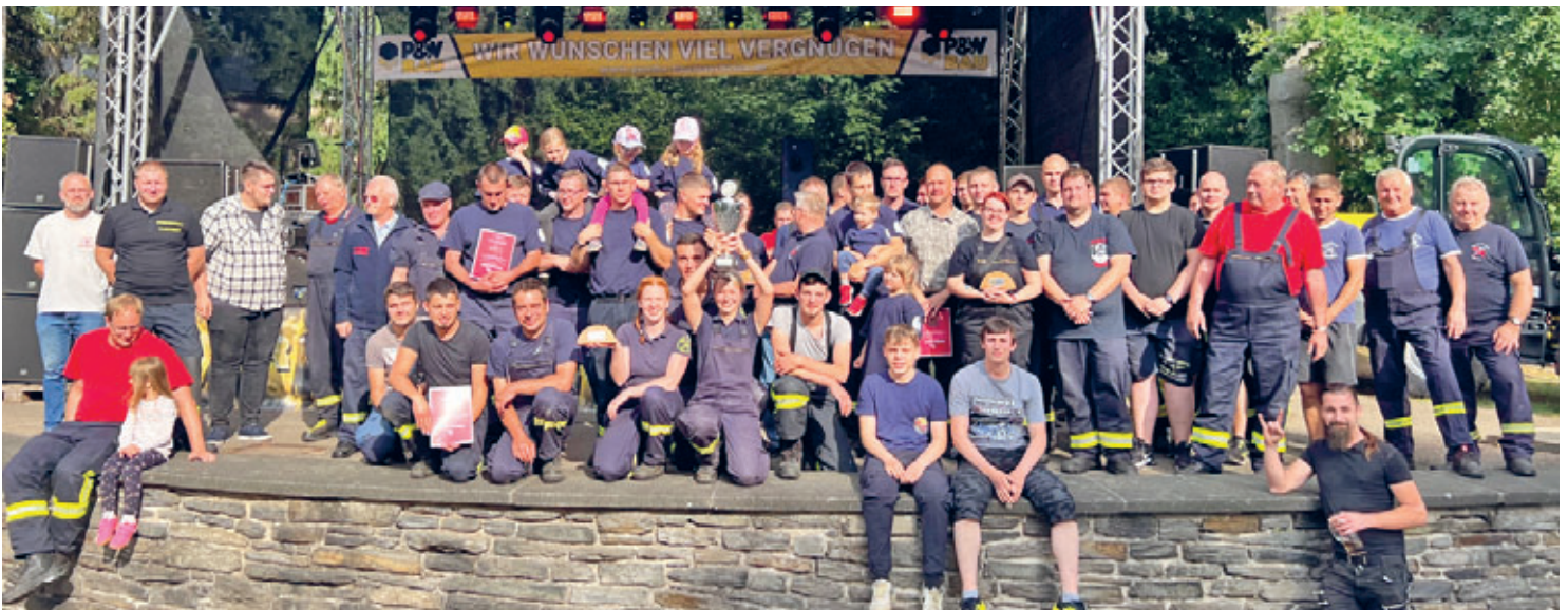
Freiwillige Feuerwehr Cunnersdorf siegte beim Leistungsvergleich im Löschangriff