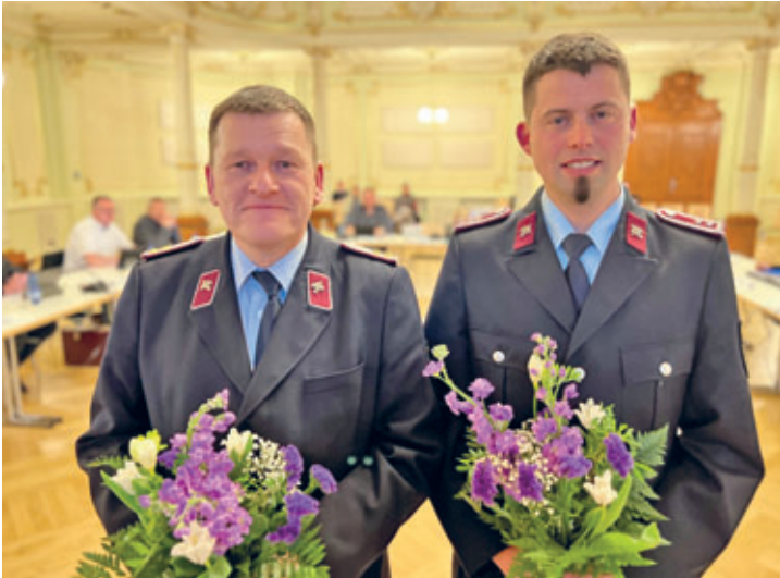
Der Stadtrat bestätigte die neue Wehrleitung der FFW Cunnersdorf