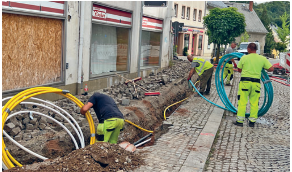
Kabelarbeiten für den Breitbandausbau auf der Mühlstraße