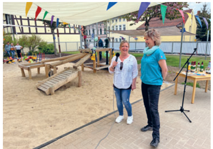
Im DRK-Hort AlberTina wurde die neue Matschstrecke und ein Sandspielplatz eingeweiht.