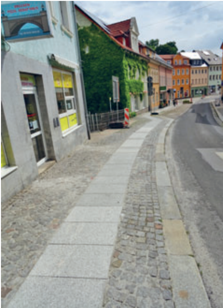
Verlegung von Granitplatten (Bequemlichkeitsstreifen) auf den Gehwegen unserer Stadt