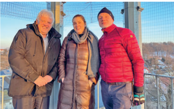
Geschäftsführung der Kulturhauptstadt Europas Chemnitz 2025 GmbH zu Gast in Hainichen