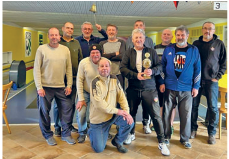
interne Meisterschaft der „Alten Herren Fußballmannschaft“ auf der Kegelbahn