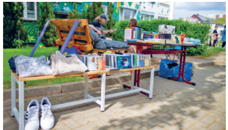
Flohmarkt im Jugendclub auf der Wiesenstraße