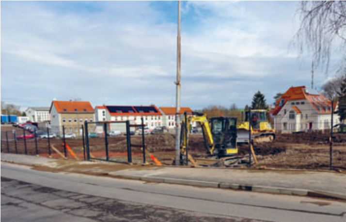
Abrissmaßnahme WEURO/Lederwerk abgeschlossen