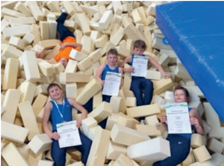
Turner des ATV waren erfolgreich bei den Turnbezirksspielen in Chemnitz