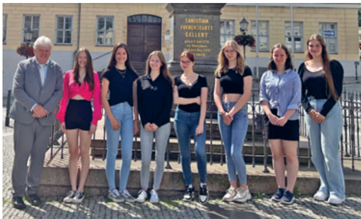
Ehrung der besten Abgangsschülerinnen unserer Friedrich-Gottlob-Keller-Oberschule in Hainichen