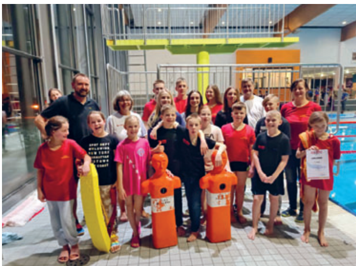
erfolgreicher Einstieg in das neue Wettkampfsjahr der DLRG Mittelsachsen 20