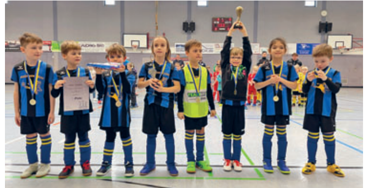
HFV Hallencup der Bambinis am 22.01.2023