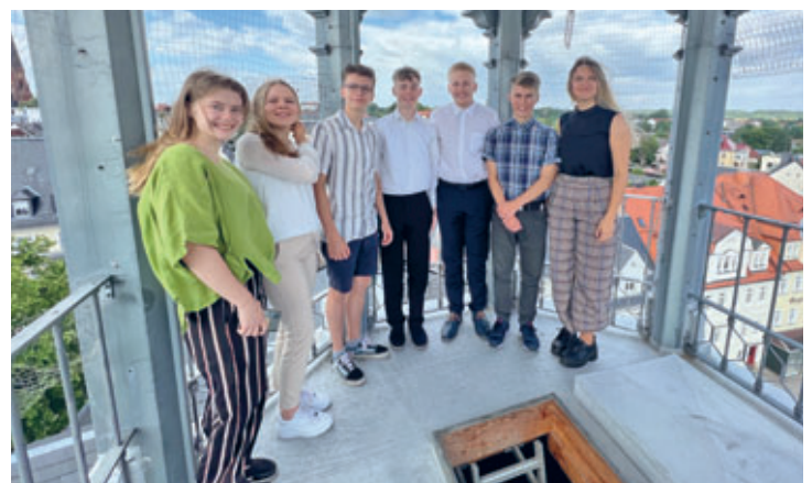
Ehrung der besten Hainichener Abiturienten und Abiturientinnen am Frankenberger Martin-Luther-Gymnasium