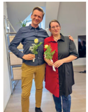
Stadtelternrat Hainichen neu gewählt