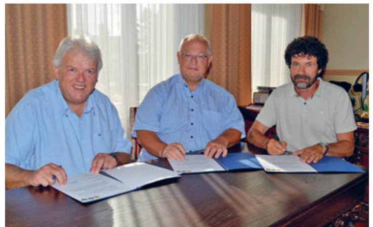
Vertragsunterzeichnung zur interkommunalen Zusammenarbeit – TexTour