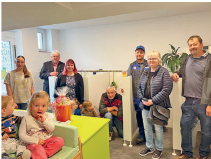
sanierte Waschräume in der Kindertagesstätte "Villa Zwergenland"