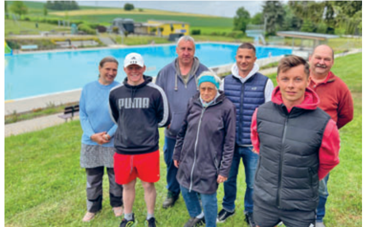
Freibadsaison endete am 12.09. nach 107 Badetagen