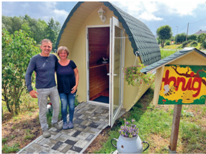
neues Angebot in Cunnersdorf – frische Eier aus dem Automaten