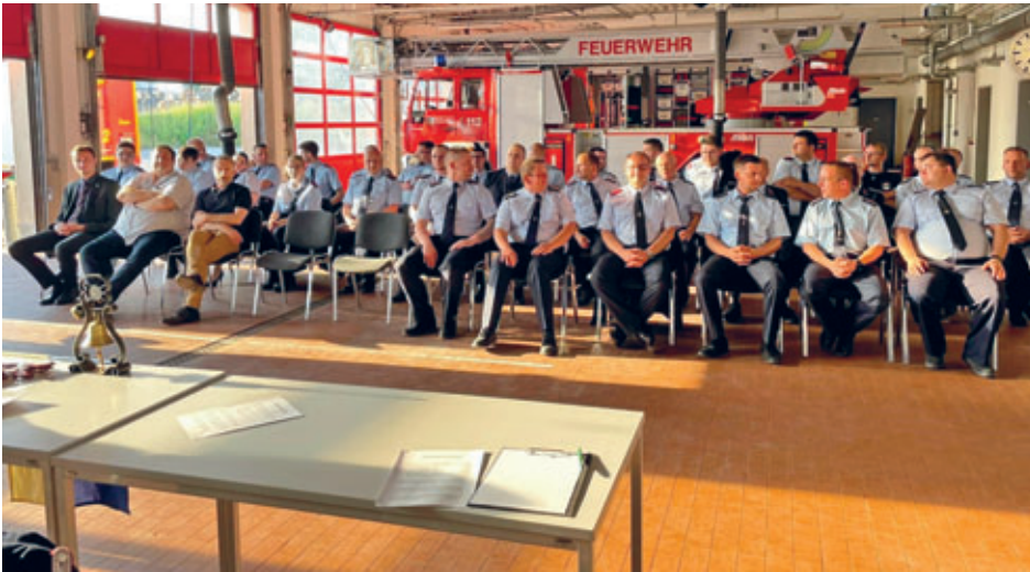
Jahreshauptversammlung der FFW Hainichen am 09.06.2023