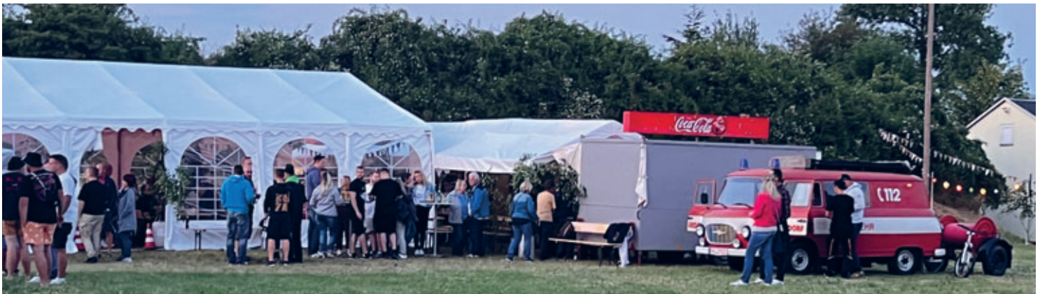
Beim Dorffest in Gersdorf/Falkenau gab es eine tolle Resonanz von allen Generationen.