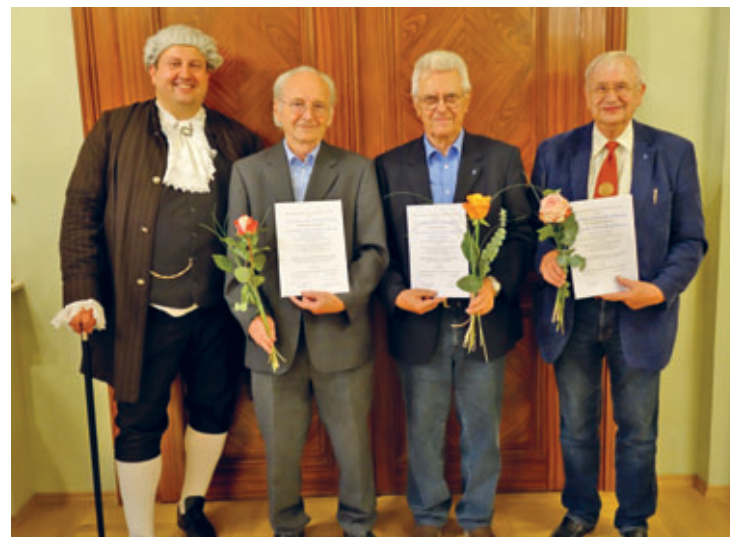
Sächsische Posaunenmission ehrte langjährige Bläser aus Hainichen und Umgebung