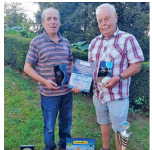
erfolgreiche Teilnahme der Rassekaninchenzüchter des S 205 Hainichen an der Landesjungtierschau