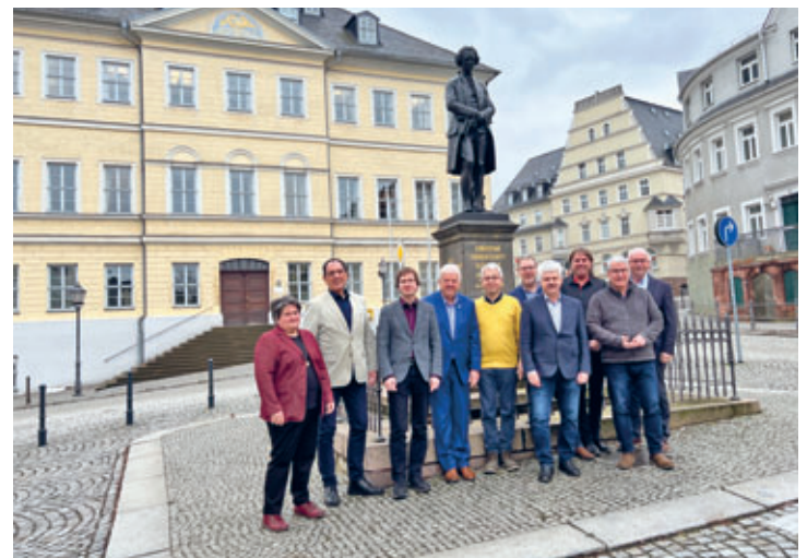
Bürgermeisterrat des Klosterbezirk Altzella tagt am 02.02. im Hainichener Rathaus