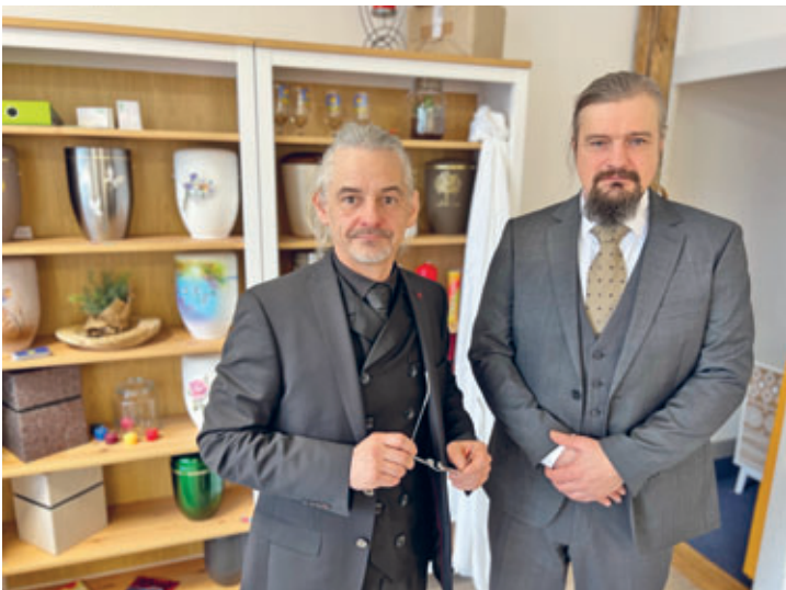
Gellertstadt-Bestattungen – ein neues Unternehmen in Hainichen