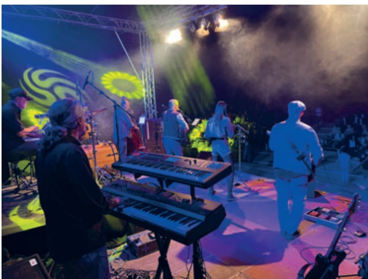
Parkfest mit viel positiver Resonanz