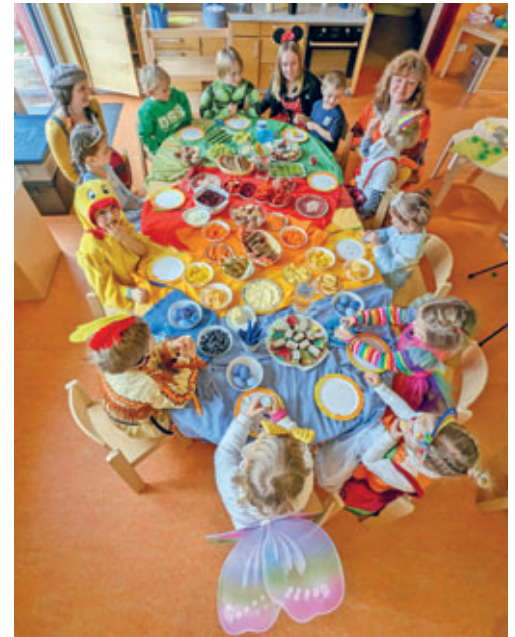
farbenfrohes Verkleidungsfest im Kindergarten Springbrunnen