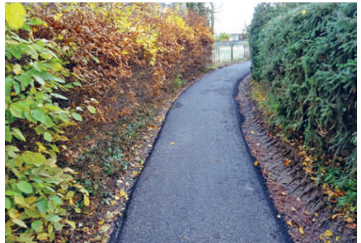
Kleiner Weg in Falkenau wird gebaut- ein lang ersehnter Wunsch konn- te endlich in Erfüllung gehen