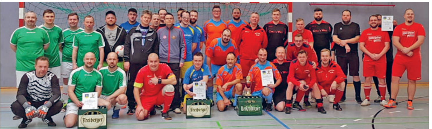
FSV Sachsen Hainichen verteidigte Stadtmeistertitel im Hallenfußball