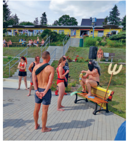
Das Badfest war trotz starkem Wind ein voller Erfolg.