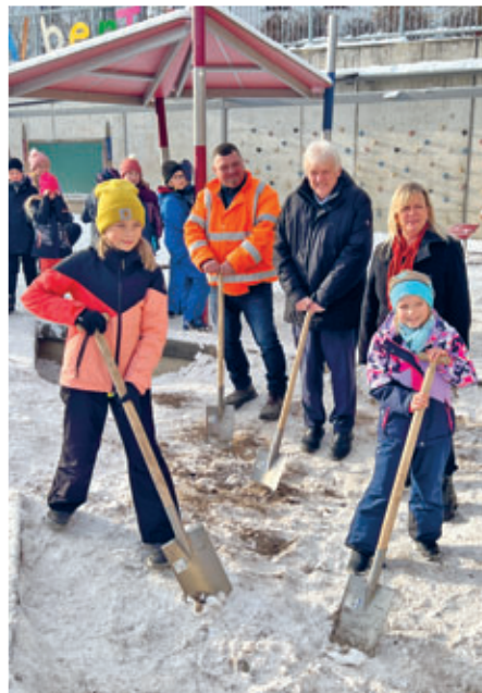
Spatenstich für die Vergrößerung des Sandkastens im DRK Hort AlberTina