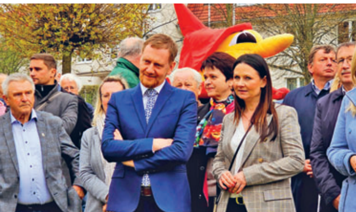
zu diesem Anlass war auch der Sächsische Ministerpräsident Michael Kretzschmer zu Gast in Hainichen