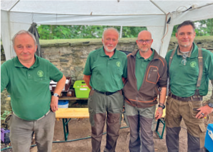
Jägerfest fand bei besten Wetter im September rund ums Schweizerhaus statt