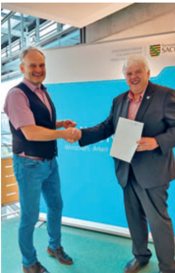
Stadt Hainichen erhielt Fördermittelbescheid für Neubau von Radwegen