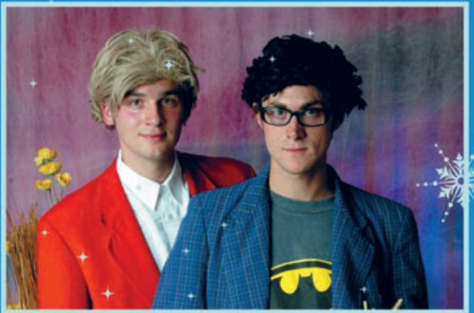
Zärtlichkeiten mit Freunden - Die schönsten Momente im März 2023 +