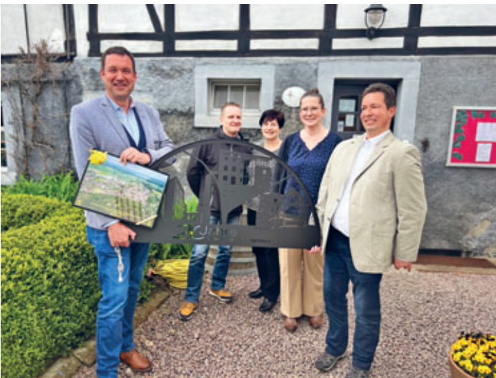
20 Jahre LAI – Liebold Architekten und Ingenieure