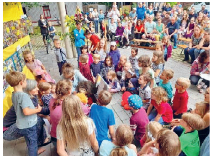
20 Jahre Kita Springbrunnen