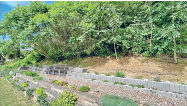
neue Sitzgelegenheiten an beliebten Wegen in Cunnersdorf