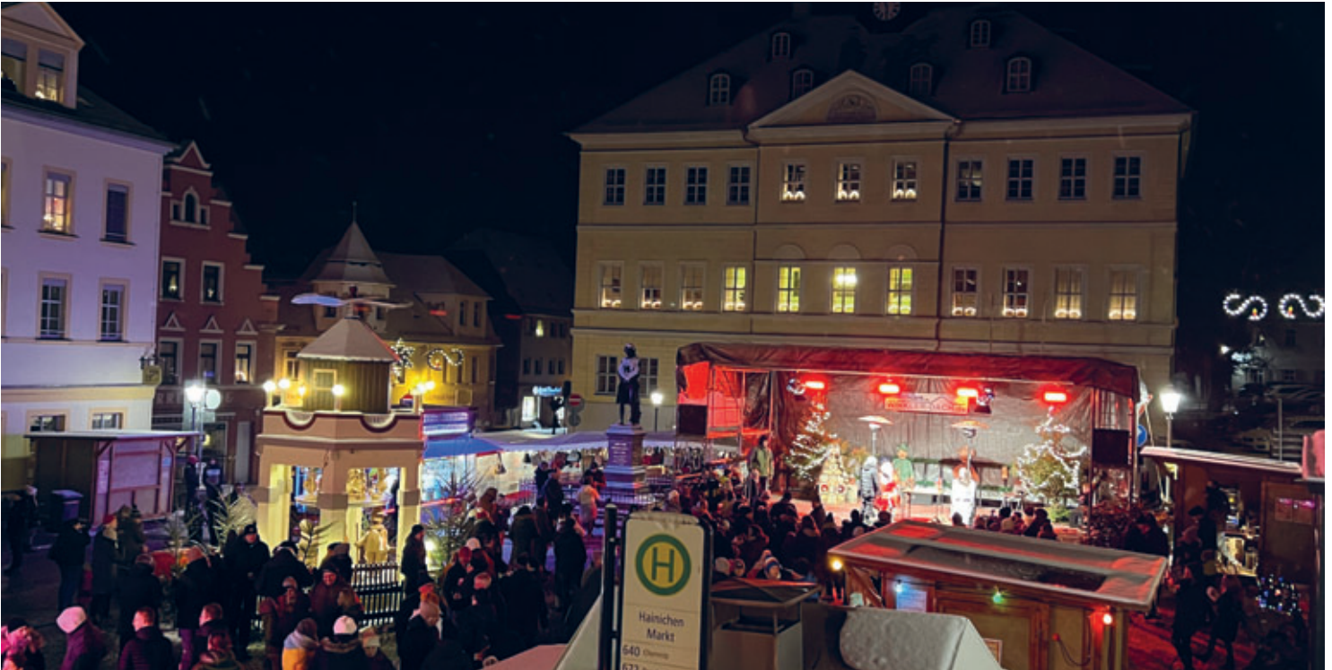
Hainicher Weihnachtsmarkt 2022 begeisterte die Gäste mit vielen Höhepunkten