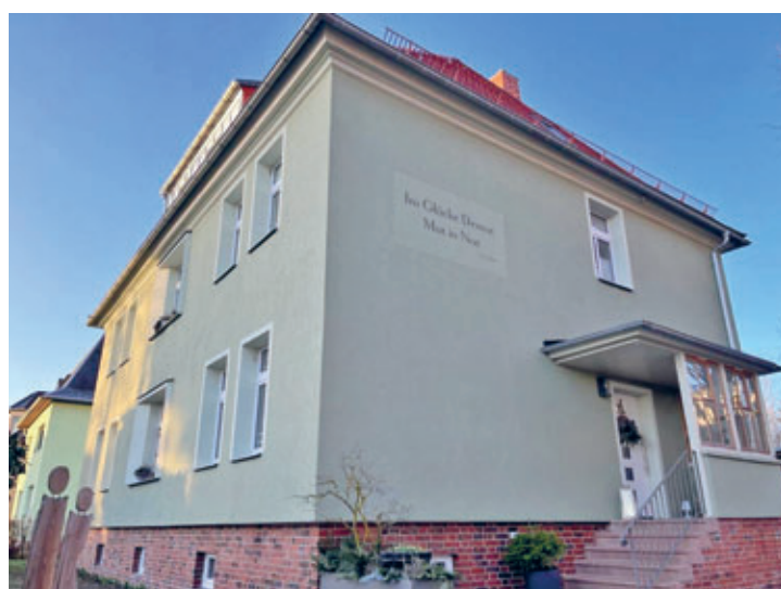
erstes Hauszitat von Christian Fürchtegott Gellert an der Fassade der Heinrich-Heine-Straße 10