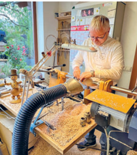
Riechberger Drechslerei Wagner öffnete zum Tag des traditionellen Handwerks ihre Türen