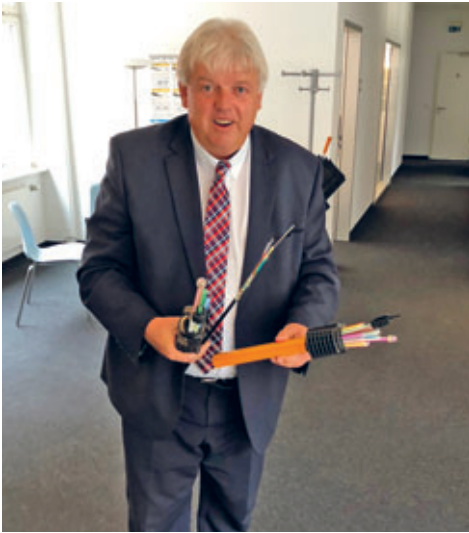
Vielen Dank für Ihr Verständnis beim Breitbandausbau für die zahlreichen Straßensper- rungen und Umleitungen. Es ist fasst geschafft.