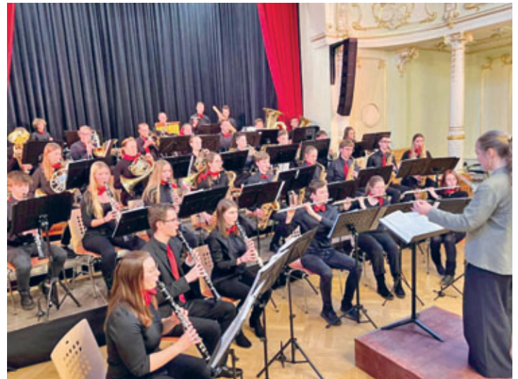
Sinfonisches Blasorchester Frankenberg begeisterte die Besucher im Goldenen Löwen