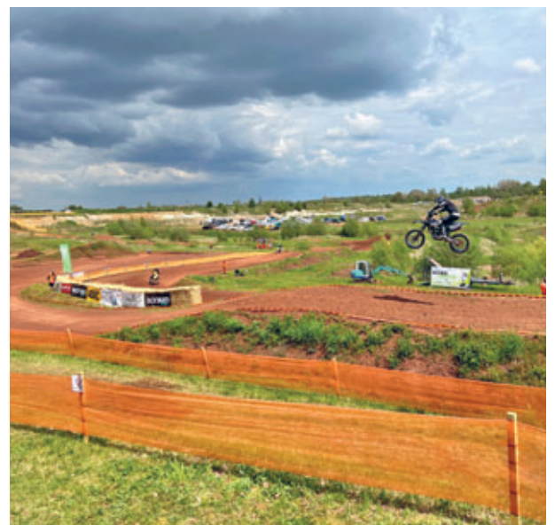
Motocrossrennen der Serie „Next Generation“ am 13.05. in der Hainichener Lehmgrube