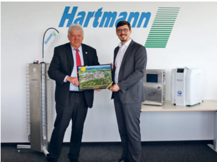
41 Jahre Firma Hartmann