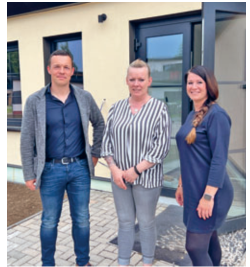
aus dem ehemaligen VW Autohaus wurde die Pflege-Wohngemeinschaft „Natürlich Wohnen“