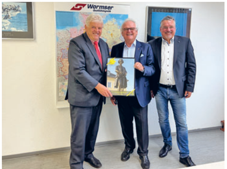
25 Jahre Hans Wormser AG in Hainichen