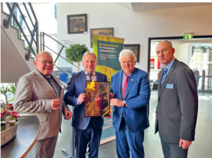
30 Jahre ZWA Hainichen