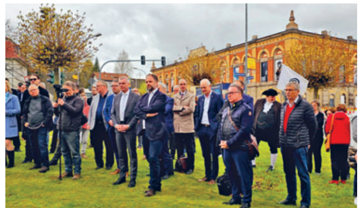
Gremienmitglieder des Deutsche Städte- und Gemeindebundes auf dem Weg zur Tagunug im Goldenen Löwen