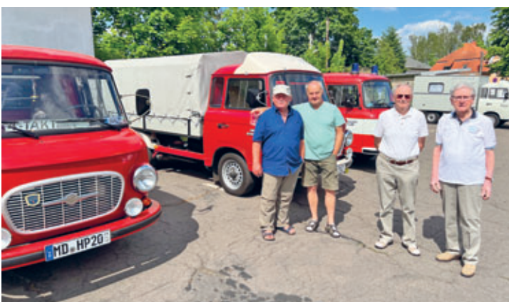
BARKAS-/FRAMO-Treffen auf dem Gelände der Firma Sonnenberg