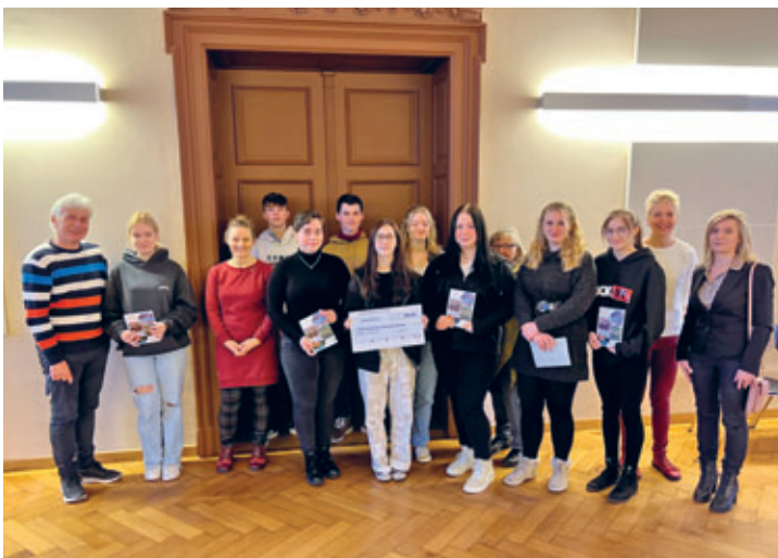
„Danke“ an die großzügigen Spender des Neujahrsempfangs für die Friedrich-Gottlob-Keller-Oberschule