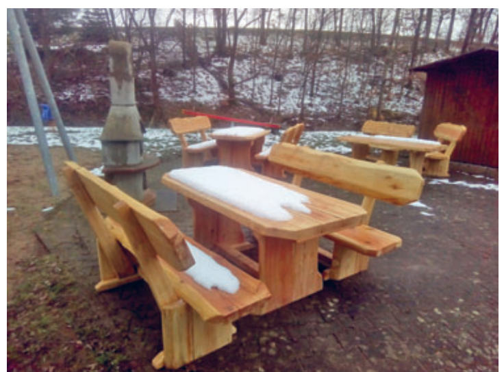
neue Sitzmöglichkeiten in Eulendorf