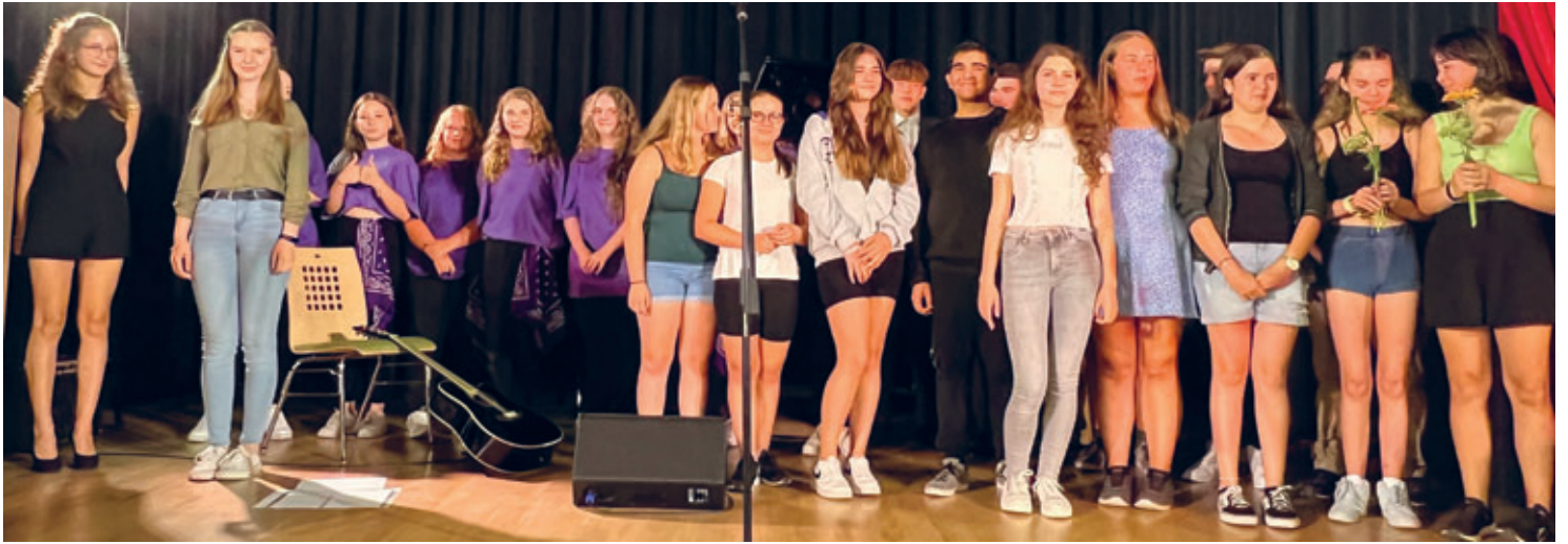
10-jähriges Namensjubiläum der Friedrich-Gottlob-Keller-Oberschule