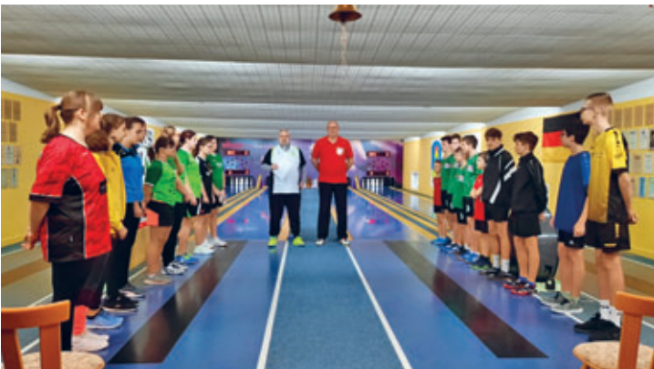
Die besten U14 Keglerinnen und Kegler des Bezirks kämpften am 01.04. in Hainichen um den Bezirkspokal