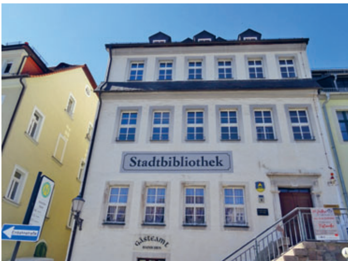
Stadtbibliothek Hainichen erhielt Schriftzug am Gebäude Markt 9