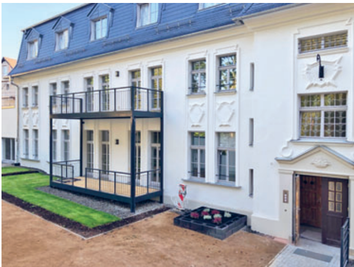
Gebäude an der Schulstraße 18 wurde erfolgreich saniert