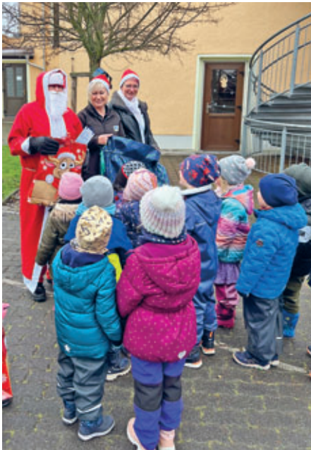
Marktleitung des EDEKA-Marktes überraschte Kinder der Kita Villa Zwergenland am Nikolaustag 2022