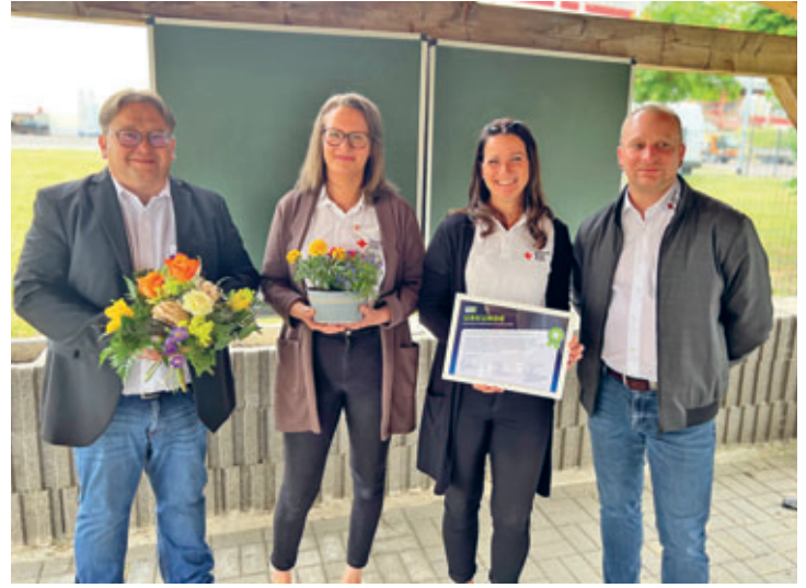
DRK Kreisverband erhielt Auszeichnung „Unternehmen mit Best-Practice-Veranstaltung“