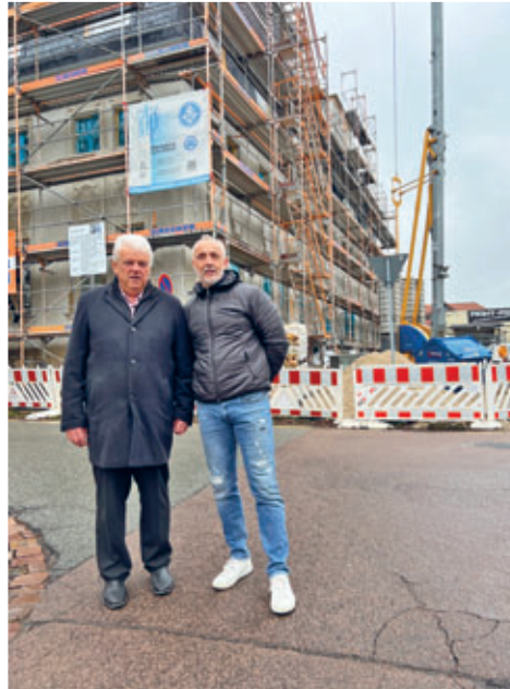
Neue Mietwohnungen in Planung