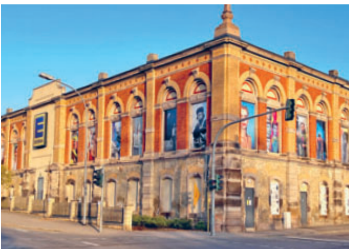
Einweihung der Fassade am EDEKA-Markt der Generationen mit Bildern bekannter Hainichener am 24.04.2023