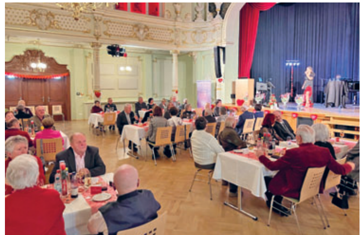
Marriage Week - Ehrenveranstaltung für Ehejubilare im Jahr 2023 im Goldenen Löwe