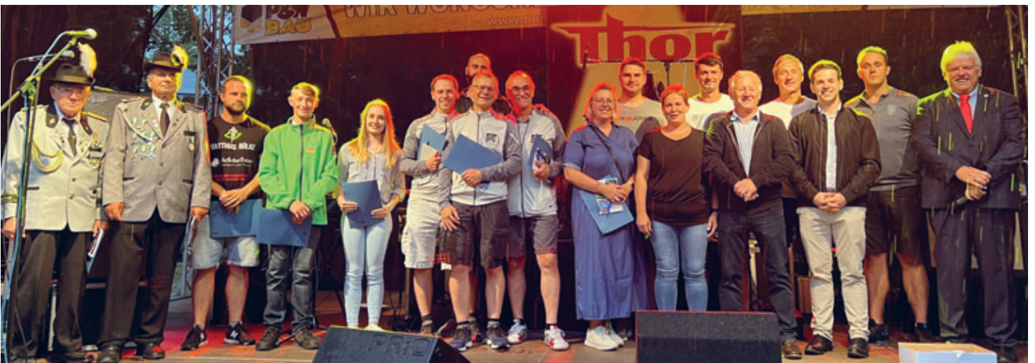
Sportlerehrung zum Hainichener Parkfest auf der Freilichtbühne