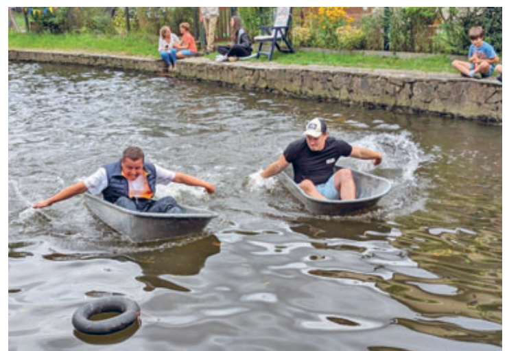
Badewannenrennen in Cunnersdorf – stellvertretende Bürgermeister im Duell