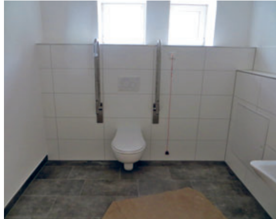
1. Bauabschnitt der Sanierung im Dorfgemeinschaftshaus Gersdorf/Falkenau erfolgreich abgeschlossen