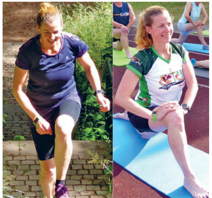
SV Motor Hainichen bietet Leichtathletik als neue Sportart an