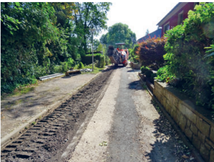
unterer Teil der Straße „Am Park“ erhielt eine neue Oberfläche