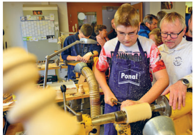
Tag des traditionellen Handwerks in der Drechslerei Wagner im Oktober begeisterte Besucher