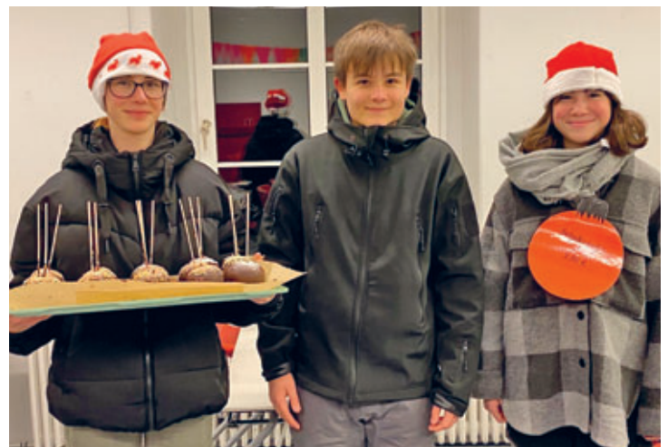
Friedrich-Gottlob-Keller-Oberschule gestaltete den Weihnachtsmarkt mit