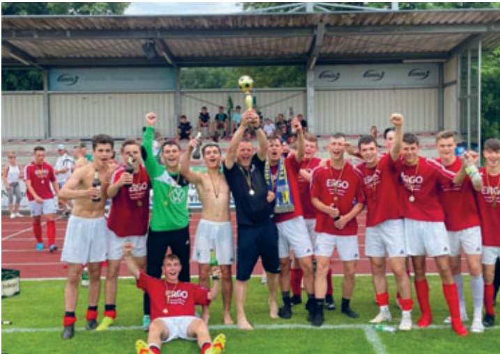
A-Jugend des Hainichener FV Blau Gelb gewann Kreispokal