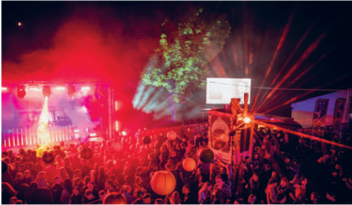
Krach am Bach 2023 - eine tolle Fete