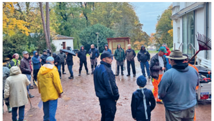
Parkpflegetag am 28.10.2023 - viele Helfer*innen kamen, um den Stadtpark zu pflegen