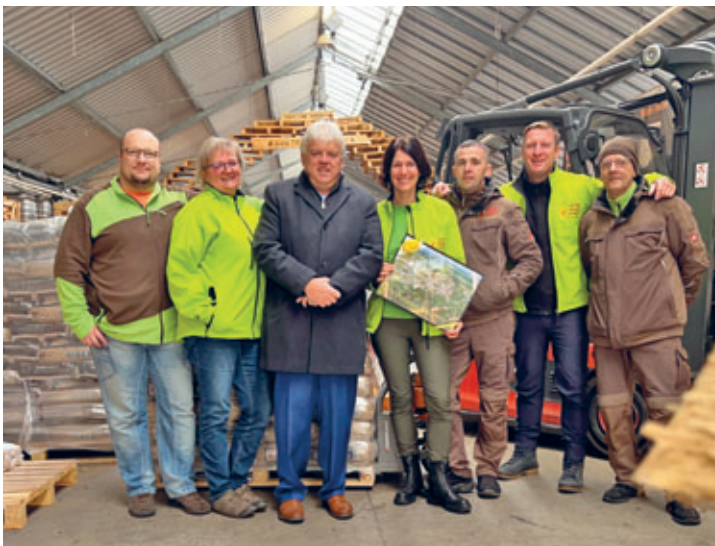
20 Jahre Naturbrennstoffe Kretschmann