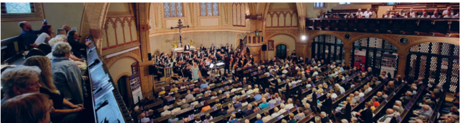
30-jähriges Jubiläum des Mittelsächsischen Kultursommers e. V. in der Trinitatiskirche Hainichen