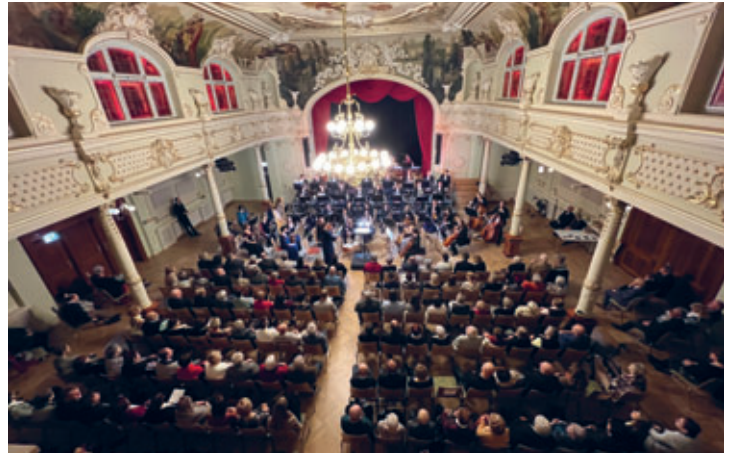
Neujahrskonzert der Mittelsächsischen Philharmonie sorgte für ausverkauften Goldenen Löwen