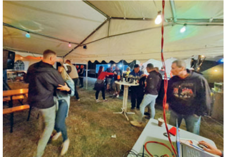
gut besuchtes Straßenfest an der Georgenstraße gefeiert