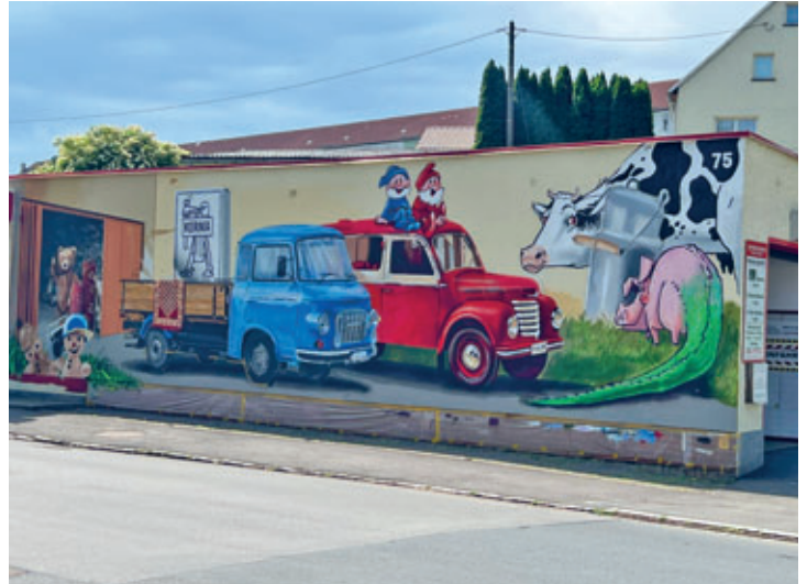
neues Graffito an der Waschstraße auf der Mittweidaer Straße