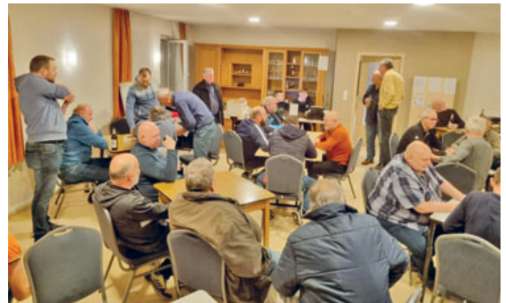
51 Spieler kamen zum 21. Bockendorfer Skatturnier am 24.02.2023