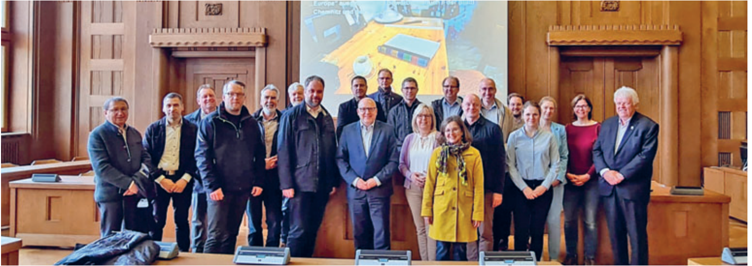
Im Rahmen der Frühjahrstagung des Deutschen Städte- und Gemeindebundes in Hainichen besuchten die Teilnehmer auch Chemnitz und wurden von Oberbürgermeister Sven Schulze über den Stand der Vorbereitungen auf dieses Ereignis informiert.