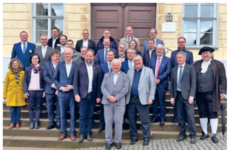
Bürgermeister aus ganz Deutschland trafen sich zur Frühjahrstagung des Bundesausschusses für Städtebau und Umwelt des Deutschen Städte- und Gemeindebundes am 24.4. in Hainichen