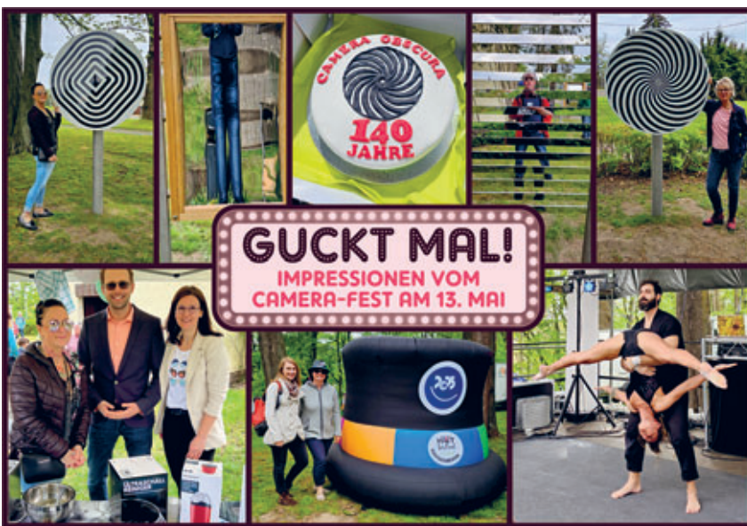
Camera-Fest am 13.05. war ein voller Erfolg