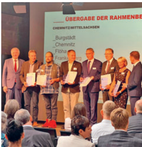
EFRE Bescheid für die Stadt Hainichen – Fördermittel für Stadtentwicklung stehen bereit