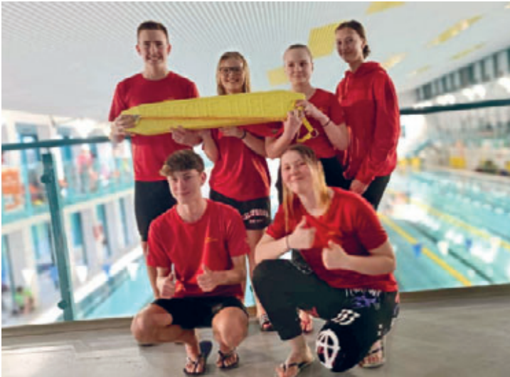
2. Mitteldeutsche Regionalmeisterschaft im Rettungsschwimmen in Riesa