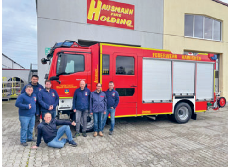
Das neue HLF 20 Fahrzeug steht seit 12.04. im Gerätehaus der FFW Hainichen