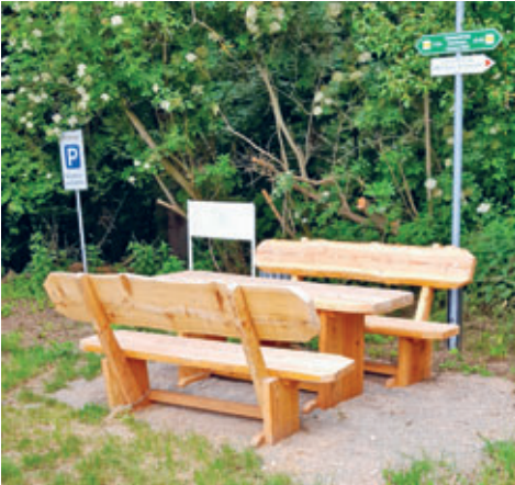
neue Sitzgelegenheit am Eingang des Wanderweges zur Verschönerung