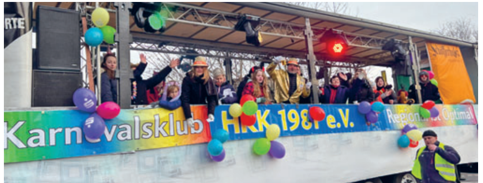
Faschingsumzug, Kinderfasching und die große Faschingsparty im HKK