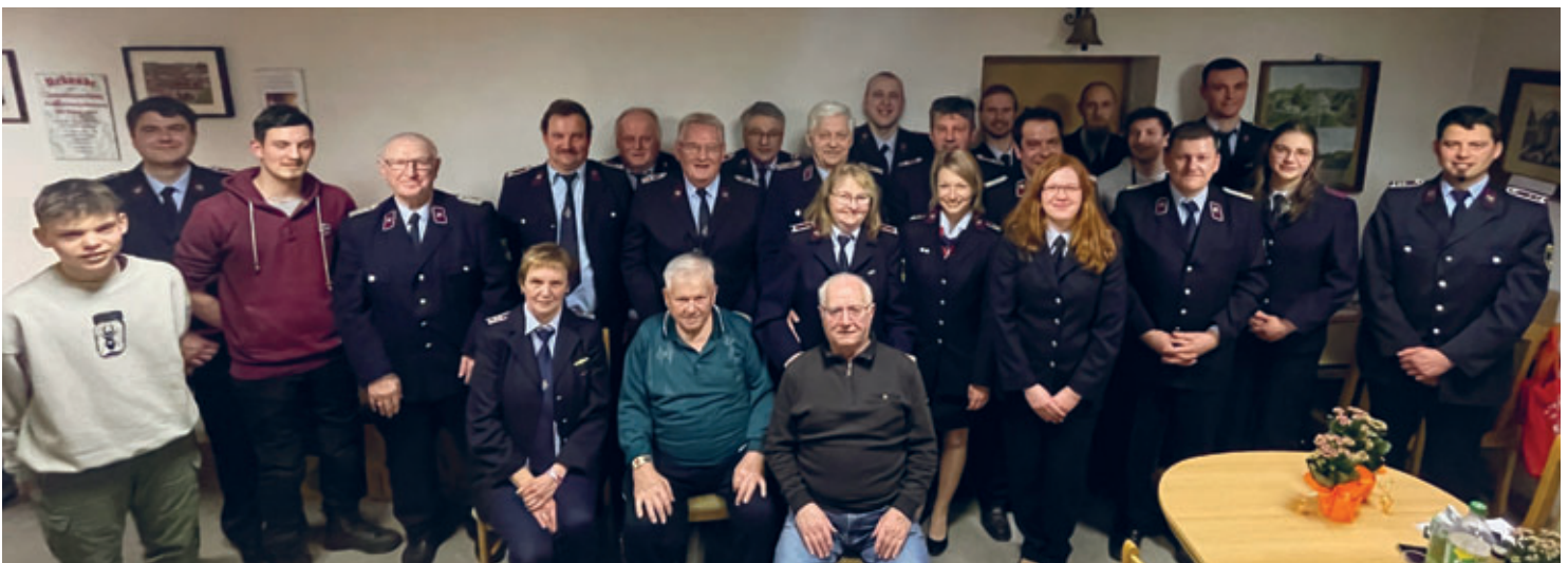
Jahreshauptversammlung der FFW Cunnersdorf am 17.03.2023