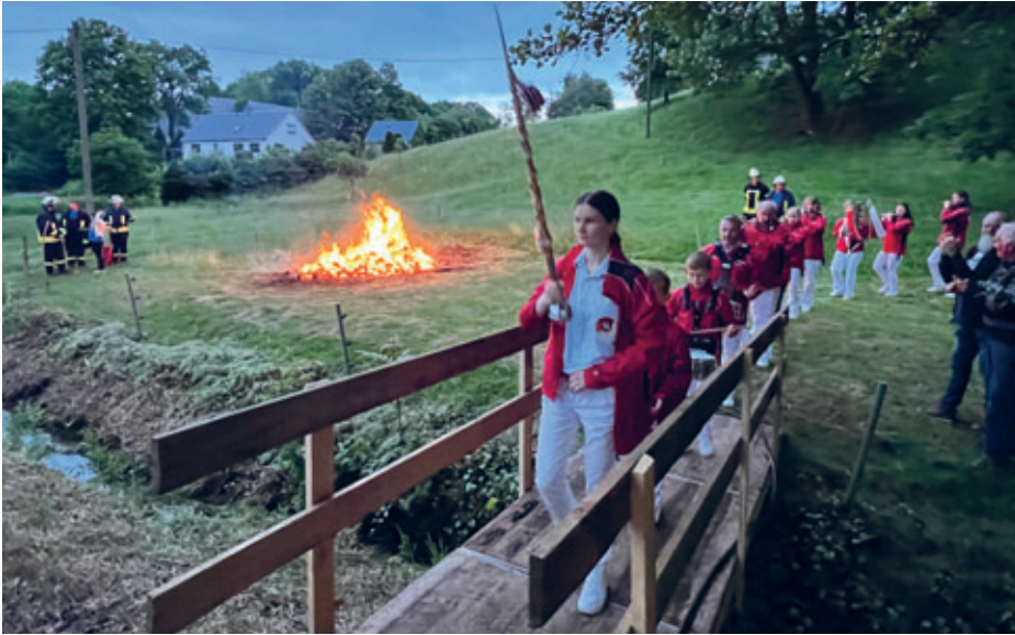
Dorffest Riechberg/Siegfried begeisterte die Gäste mit umfangreichem Musikprogramm