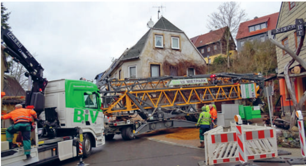
Erneuerung der Treppe zu den Oberen Berghäusern