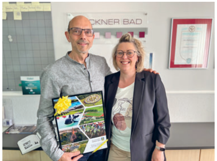
40 Jahre Firma Lauckner Bad