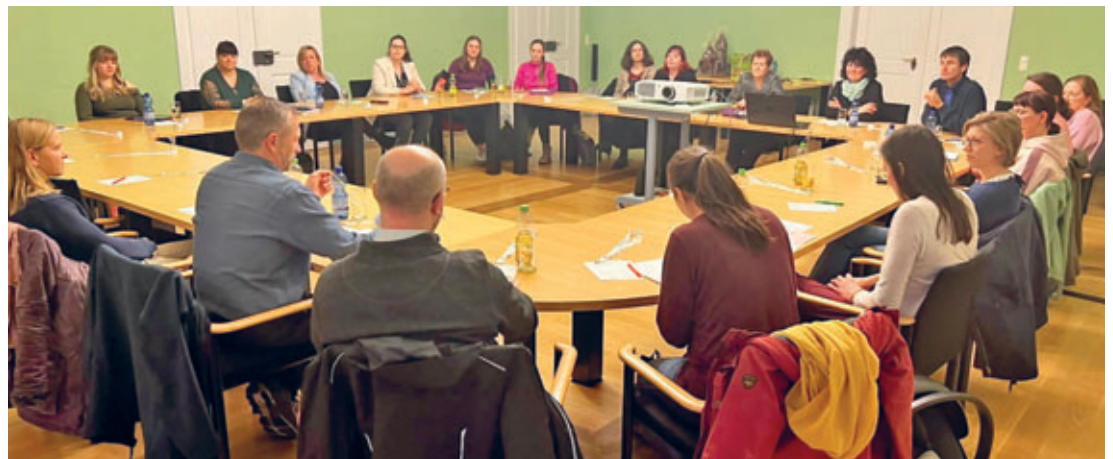
Netzwerktreffen im Hainichener Ratssaal im März diesen Jahres