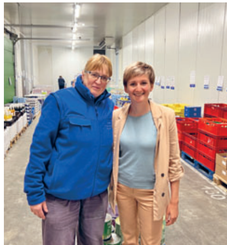
Im Gewerbegebiet Schlegel, bei der Firma Ostmilch, gibt es eine Frischehalle mit attraktiven Angeboten für Lebensmittelsonderposten.