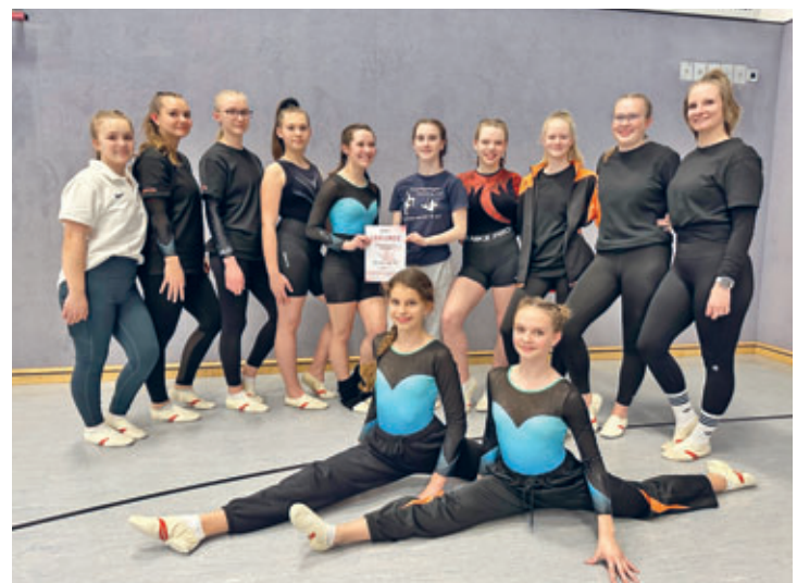
Turnerinnen des ATV qualifizierten sich für die Bezirksmeisterschaft