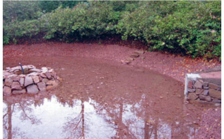
Bauarbeiten rund um den Goldfischteich beendet