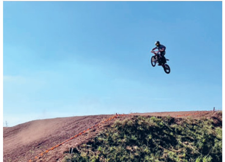
Hainichener Lehmgrube erlebte heiße Rennszenen der Sachsenmeisterschaft am 16.9.2023