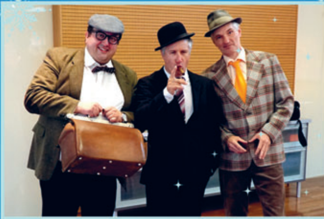
"Mächtig gewaltig Egon" - Ein Theaterstück des MISKUS am 07.02.2023