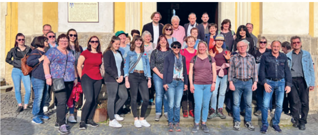
Betriebsausflug der Stadtverwaltung führte nach Ustek - unserer tschechischen Partnerstadt