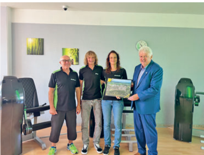
20 Jahre Fitnessstudio Scharschuch