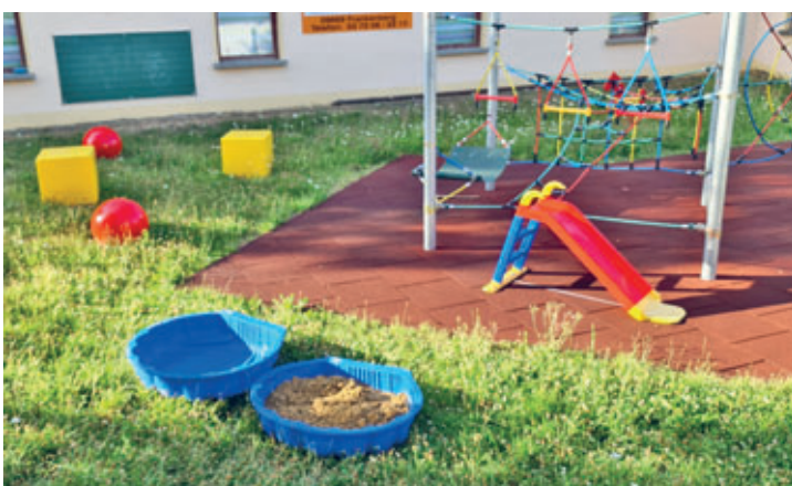
Spielplatz in Schlegel erfreute sich an neuer Tafel