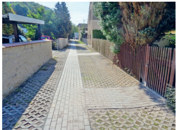
Bauarbeiten am Gehweg in der Kohlengasse beendet