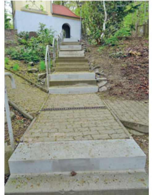
Treppe von der Gellertstraße in Richtung Elektrische Kirche instandgesetzt