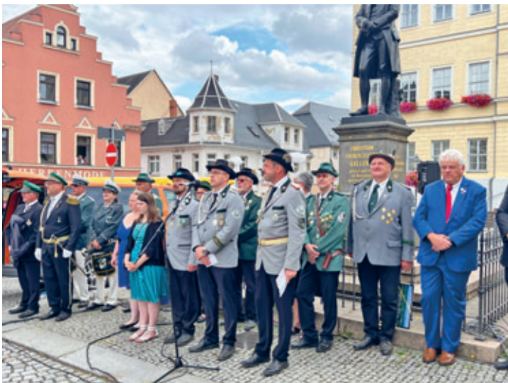
grandioses Schützenfest 2023