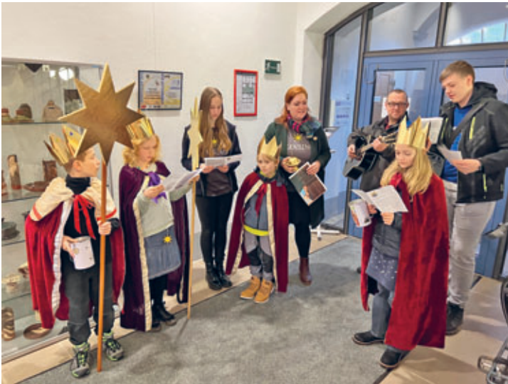
Sternsinger überbrachten Segenswünsche für unsere Stadt