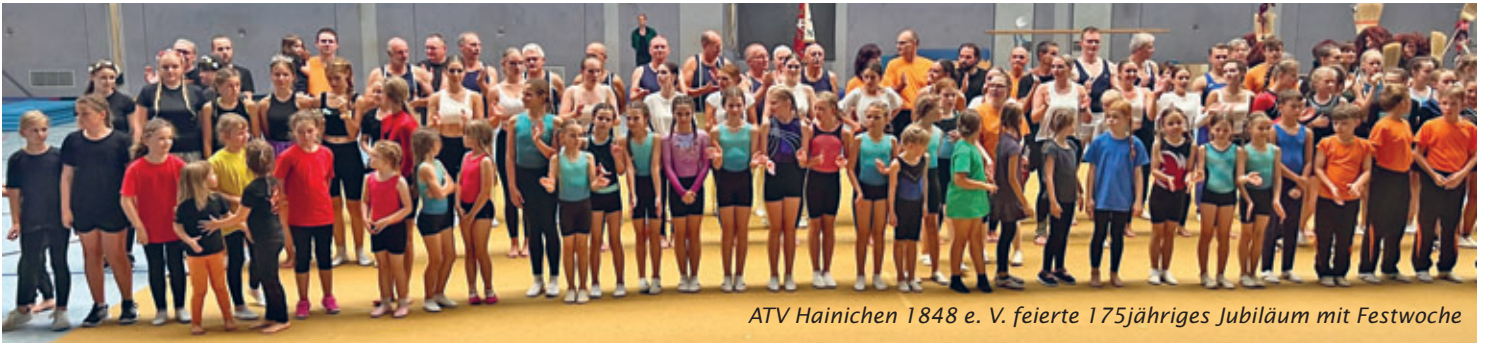
ATV Hainichen 1848 e. V. feierte 175jähriges Jubiläum mit Festwoche