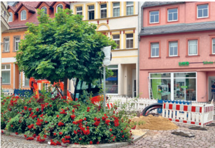
Gellertplatz mit Breitband versorgt