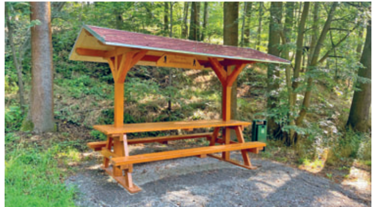
Riechberg erhielt neue überdachte Sitzgruppen