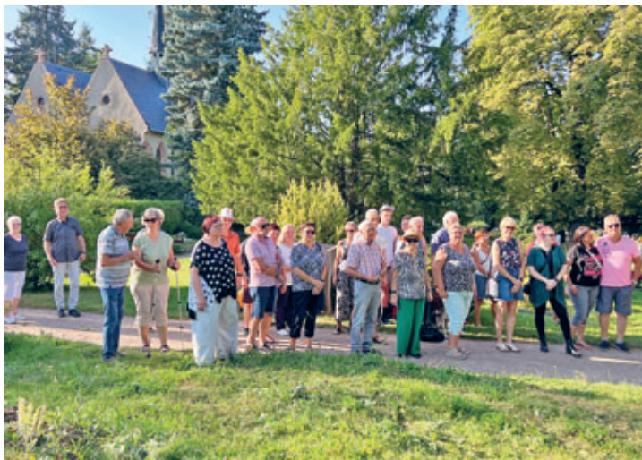
„Tag des offenen Denkmals“ sorgte auch in Hainichen für viele Besucher