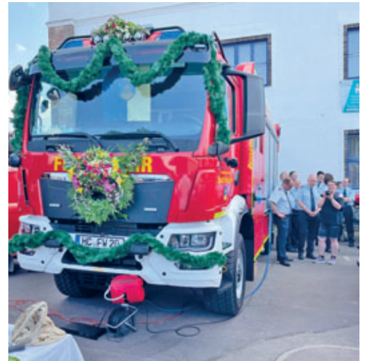
Weihe des neuen Hilfeleistungslöschfahrzeuges HLF20 am 10.06.