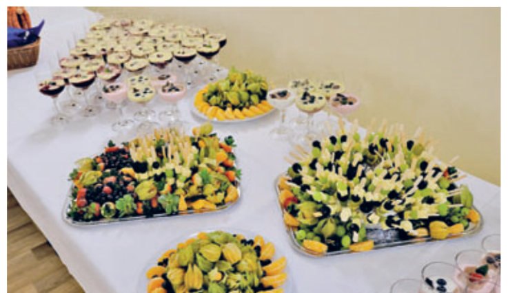
Der Neujahrsempfang 2023 war der erste seiner Art im Neorokokosaal des Goldenen Löwen