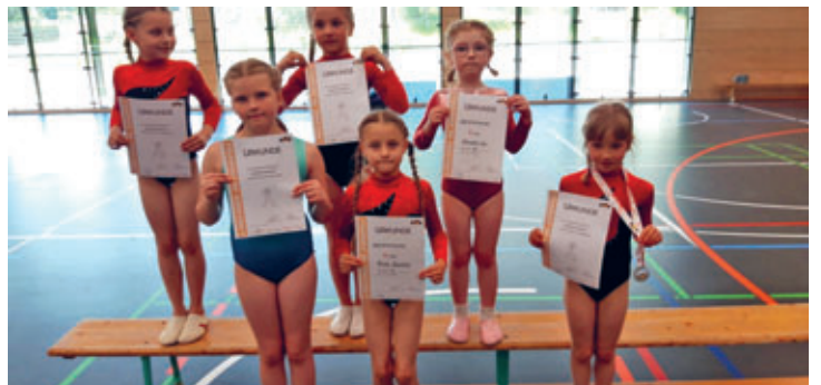
19 Turnerinnen und Turner vom ATV waren bei den diesjährigen Kreis-, Kinder- und Jugendsportspielen erfolgreich