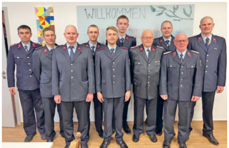
Jahreshauptversammlung der FFW Gersdorf/Falkenau am 21.04.2023 in Christas Scheune